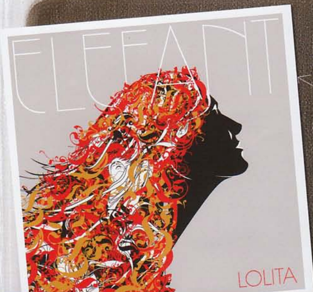
Lolita / Elefant / Cover Art for Album