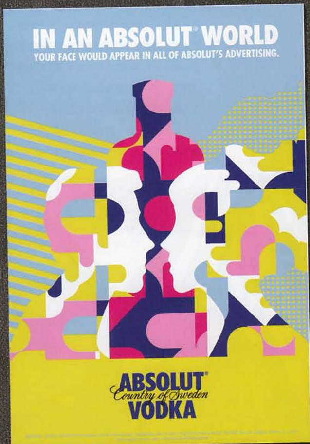
In An Absolut World / Absolut Vodka / Event Visual

Website : www.toddalanbreland.com Contact : todd@toddalanbreland.com 協力翻譯 : Felix