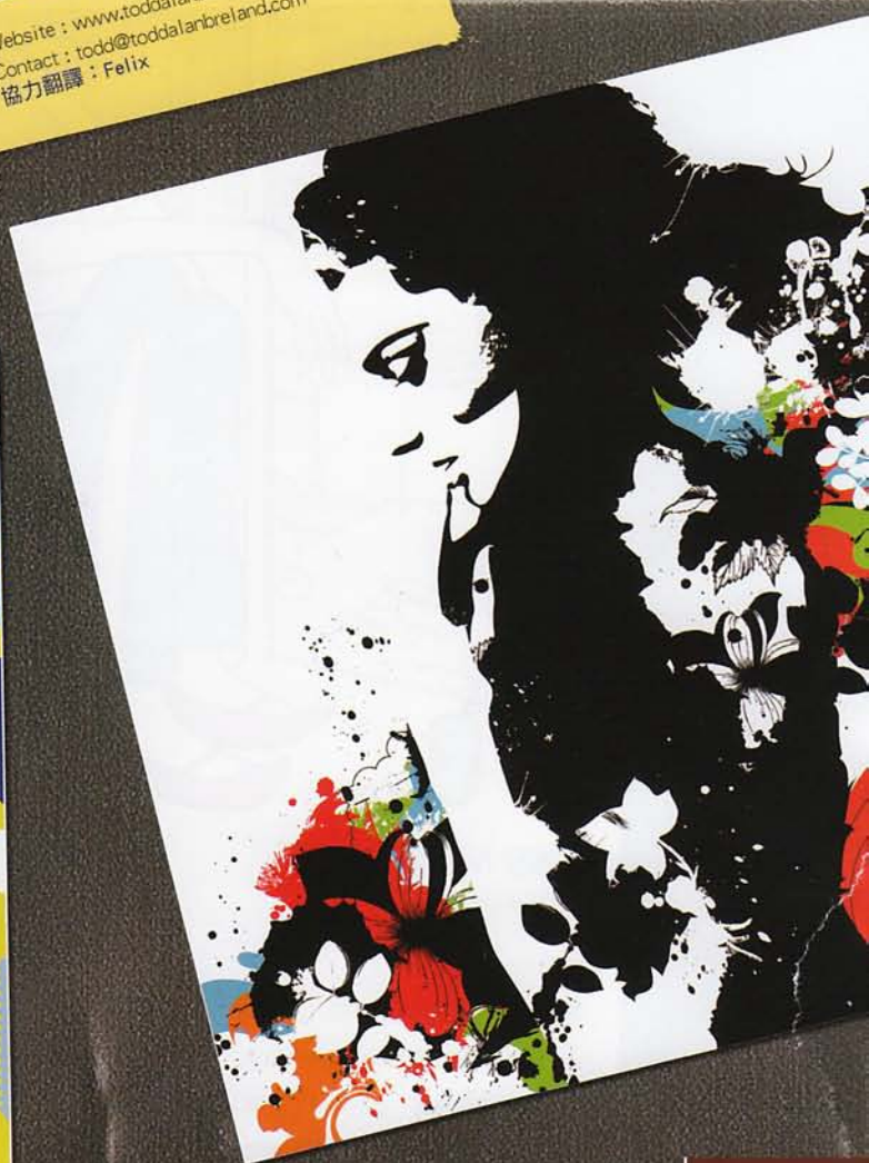
Debuten / Flared / Cover Art for Album