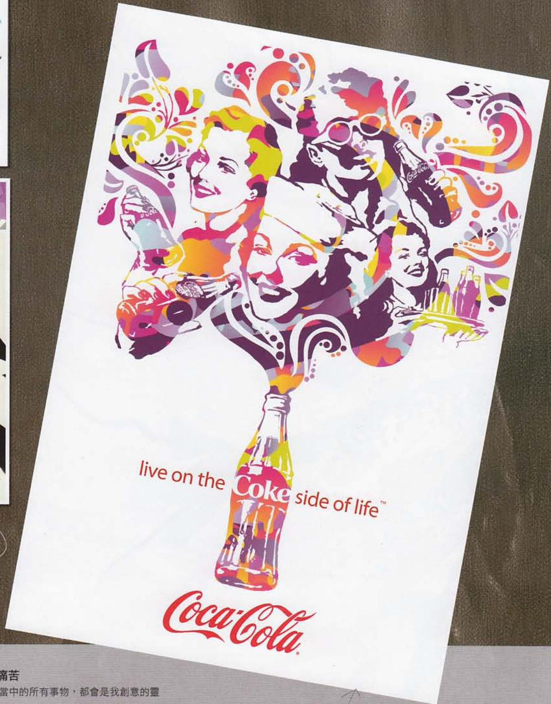
Coke Side Of Life / Coca-Cola / Advertising Campaign