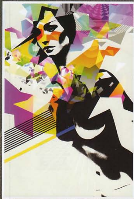
Clarity / Absolut Vodka / Exhibition Piece for Absolut Vodka Event