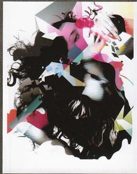
X / Personal Work