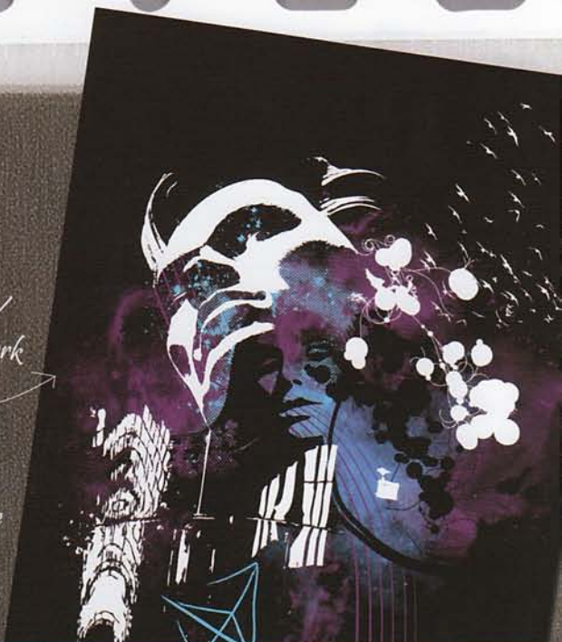
Pepsi Girl / Pepsi / Artwork for Signature Aluminum Pepsi Can